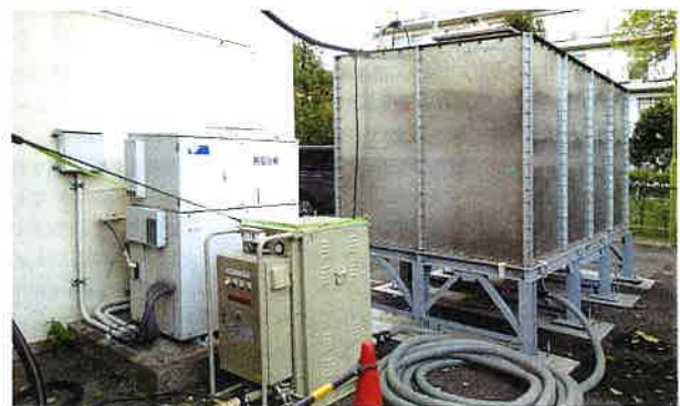
施工例 仮設受水槽と加圧ユニット組み合わせ

また、コスモテクニカルでは、ポンプや電気配線、プールや薬品FRPタンク等の修繕工事にも対応。新品同様の仕上がりに定評があります。「弊社は今年で創業20年を迎えます。会社を継続していくためにも、常に攻めの姿勢で事業内容をアップデートし、弊社独自のサービスを提供していきたいと思っています」と、意欲を語って下さいました。